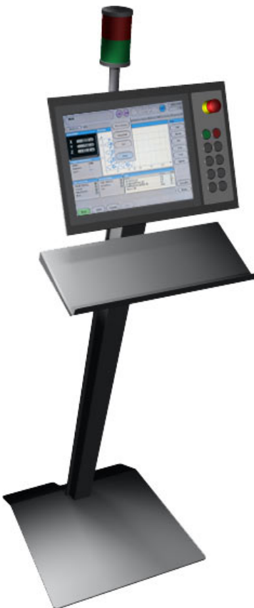
Aartac™ Control Panel mit Standfuss und Tastaturablage