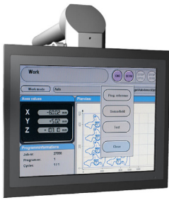
Aartac™ Control Panel für Tragarmssystem mit Folientastatur